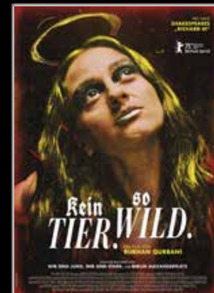
Der neue Film von Burhan Qurbani (Berlin Alexanderplatz)